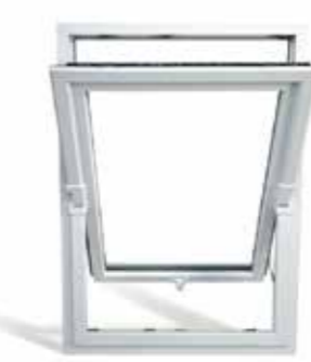
Finestra a bilico.

Solida, performante, snella e da oggi anche simmetrica e più luminosa! Prismatic Evolution racchiude in sé tutte le migliori caratteristiche e performance isolanti di Prismatic, ma con quel qualcosa in più: una simmetria perfetta resa possibile dal nodo centrale ridotto con la maniglia esattamente al centro anziché decentrata.