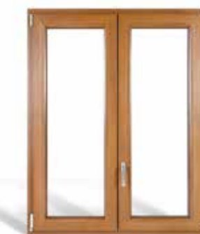
Winergetic Premium Passive.

Winergetic Premium è una finestra che offre prestazioni all'avanguardia sotto tutti i punti di vista. Il suo design elegante ospita le tecnologie più evolute al servizio dell'isolamento termico. Progettata per proteggere al meglio la tua casa dalle temperature esterne e dagli agenti atmosferici, Winergetic Premium è certificata in classe A da CasaClima.